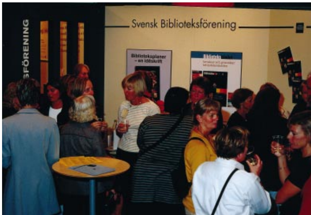
Föreningens monter var välbesökt under hela Bok & Biblioteksmässan i Göteborg. Bland annat arrangerade föreningens specialgrupp för barnbibliotek ett möte för sitt nätverk